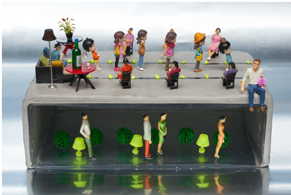
冼倩文 Ecstasy #2 Mixed Media on glass 29 x 18 x 8.5 cm, 2021